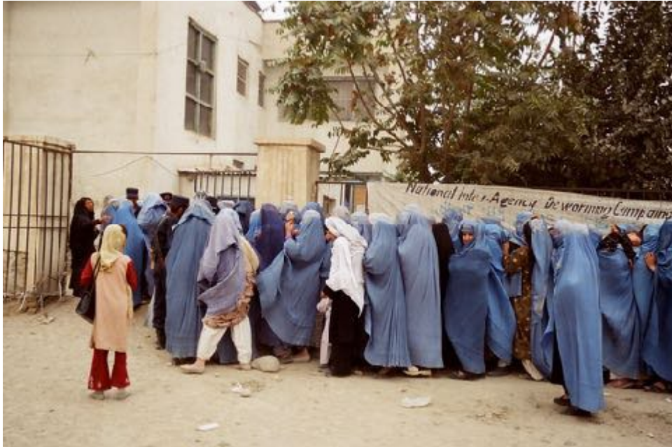
Foto: Mujeres afganas en unas elecciones haciendo cola para ir a votar.

Desde el año 2021 sólo dentro del territorio hay 800.000 personas desplazadas en su propio país a consecuencia de un país absolutamente militarizado y absolutamente condicionado por la introducción de armas que llevan entrando desde hace décadas y que se incrementó mucho más a partir del 2001. En total son 5 millones de personas afganas refugiadas sobre todo en Pakistán, Irán y en Turquía.