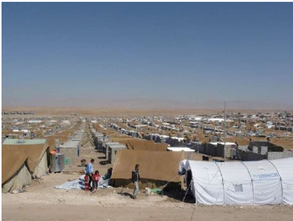
Foto: Estos son los grandes campos de refugiados que empiezan a instalarse ya en 2003 primero en Irak, luego en la frontera con Siria, con Jordania, luego en Jordania, luego en Siria, luego en el Líbano, luego en Turquía y que no sólo no han desaparecido, sino que se extienden cada vez más.

Y sobre todo el poder que tienen los clérigos es enorme en esos territorios condicionados por la violencia y por la guerra.