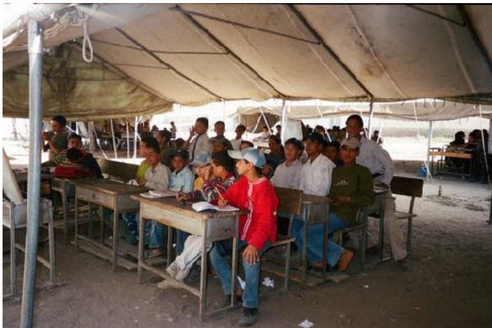
Foto: Escuela para niños refugiados.

Desde el año 2021 sólo dentro del territorio hay 800.000 personas desplazadas en su propio país a consecuencia de un país absolutamente militarizado y absolutamente condicionado por la introducción de armas que llevan entrando desde hace décadas y que se incrementó mucho más a partir del 2001. En total son 5 millones de personas afganas refugiadas sobre todo en Pakistán, Irán y en Turquía.