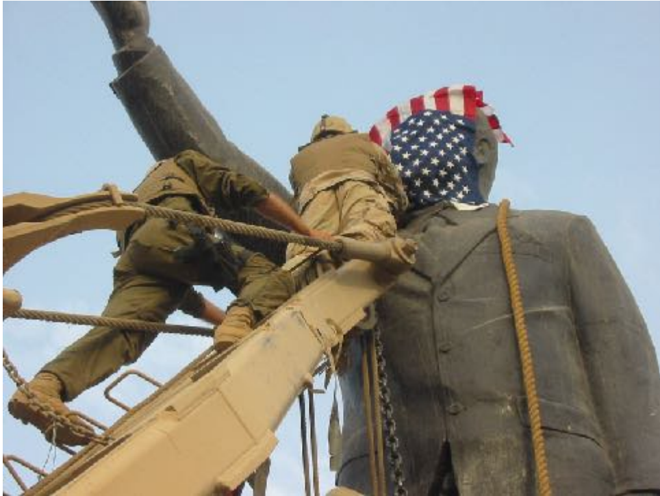
Foto: Plaza Paraíso tras el derribo de la Estatua de Saddam Husein. Hubo un momento el día del derribo de esa estatua, el 9 de abril de 2003 que había sido el que nos atacaran los estadounidenses, un soldado se vino arriba y colocó durante unos segundos esa bandera, lo cual implicaba la escenificación de una ocupación. Esto creó mucha polémica en Estados Unidos y de hecho buena parte de los medios censuraron esa imagen que yo pude tomar desde abajo porque suponía reconocer una ocupación que ellos estaban negando. Les decían que habían ido allí a liberar al pueblo iraquí y estas cosas.