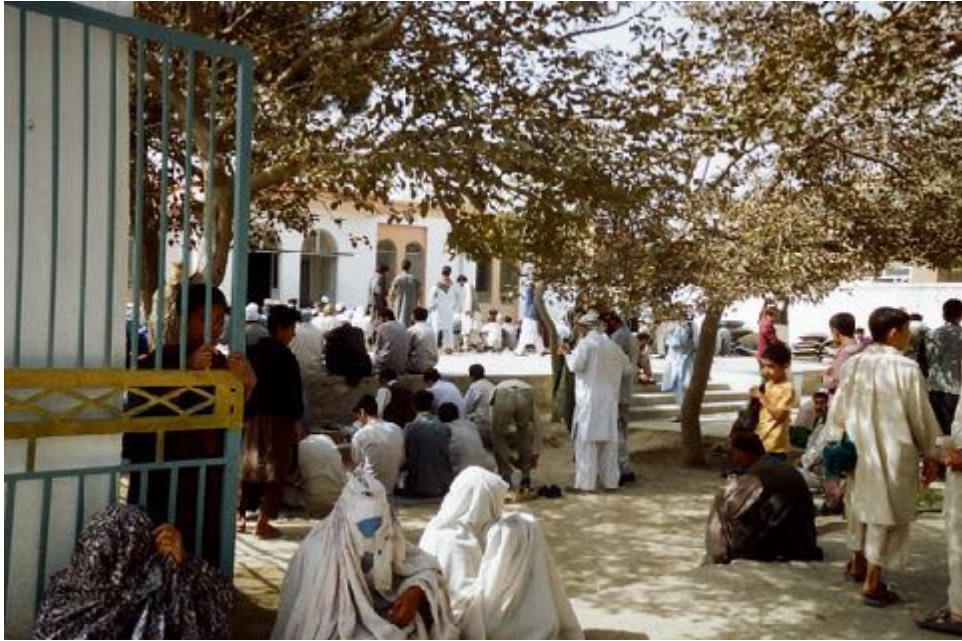
Foto: Viudas afganas que suelen llevar burkas blancos y viven o piden a las puertas de las mezquitas.

La perpetuación de la guerra de Afganistán y todo lo que ha ocurrido estos años ha supuesto nuevos éxodos y nuevos exilios.