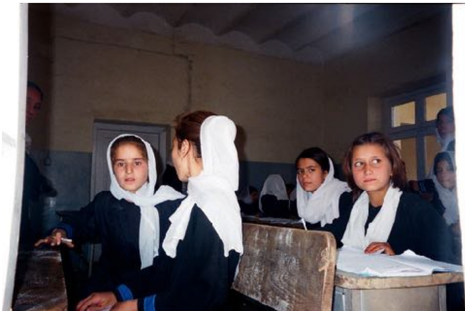
Foto: Escuela para niñas refugiadas.

Aquí la gente vive en casas hechas con palos y con telas y está sostenida por ACNUR (la Agencia de Naciones Unidas para los Refugiados).