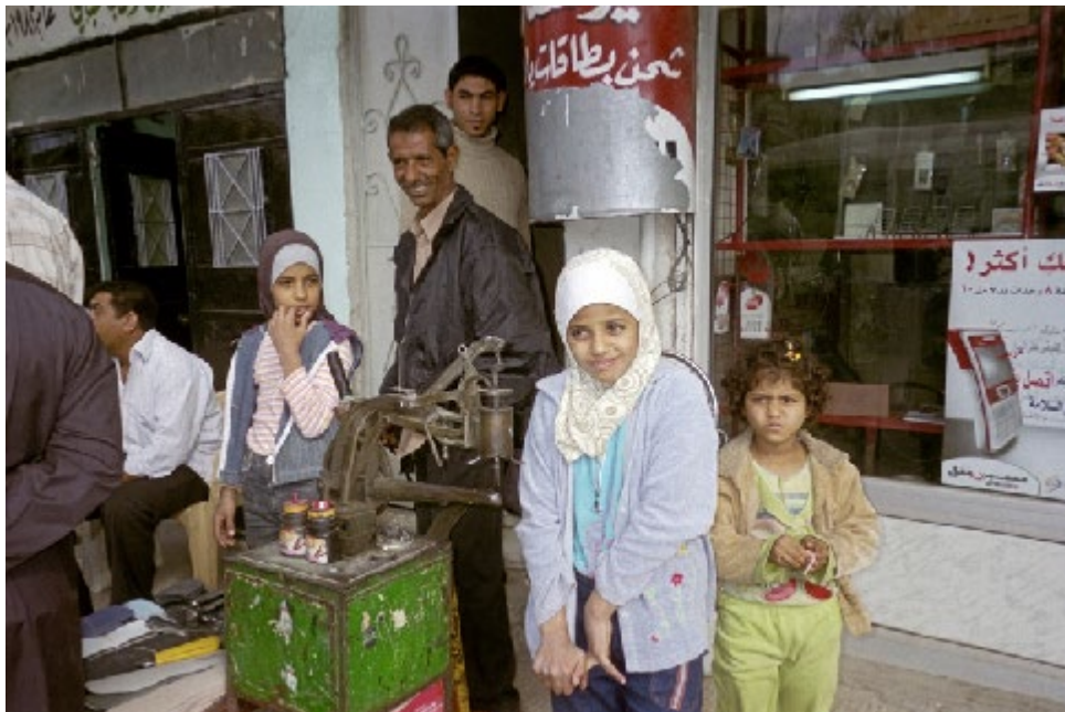
Foto: Niñas iraquíes recién llegadas a Damasco, a la capital del país vecino, huyendo de la violencia, de la persecución, de la represión.