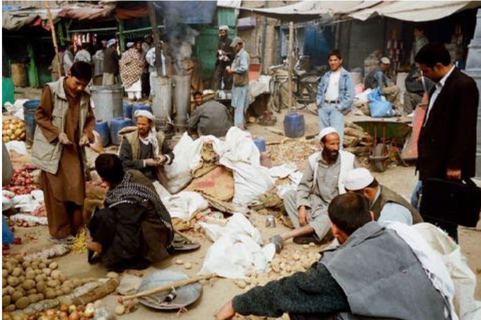
Foto: Imágenes de personas refugiadas en su propio país, en Kabul, gente que había llegado del sur del país, de Kandahar, y que pretendía llegar a otros destinos.

los derechos, a veces los de las mujeres que son de alguna manera instrumentalizados como derechos de quita y pon en función del momento geopolítico en el que nos encontremos.