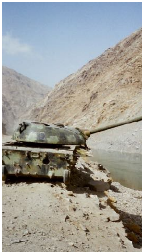
Foto: Valle del Panshir donde se han librado muchas guerras y tiene fama de ser inaccesible y es verdad que lo es.

La perpetuación de la guerra de Afganistán y todo lo que ha ocurrido estos años ha supuesto nuevos éxodos y nuevos exilios.