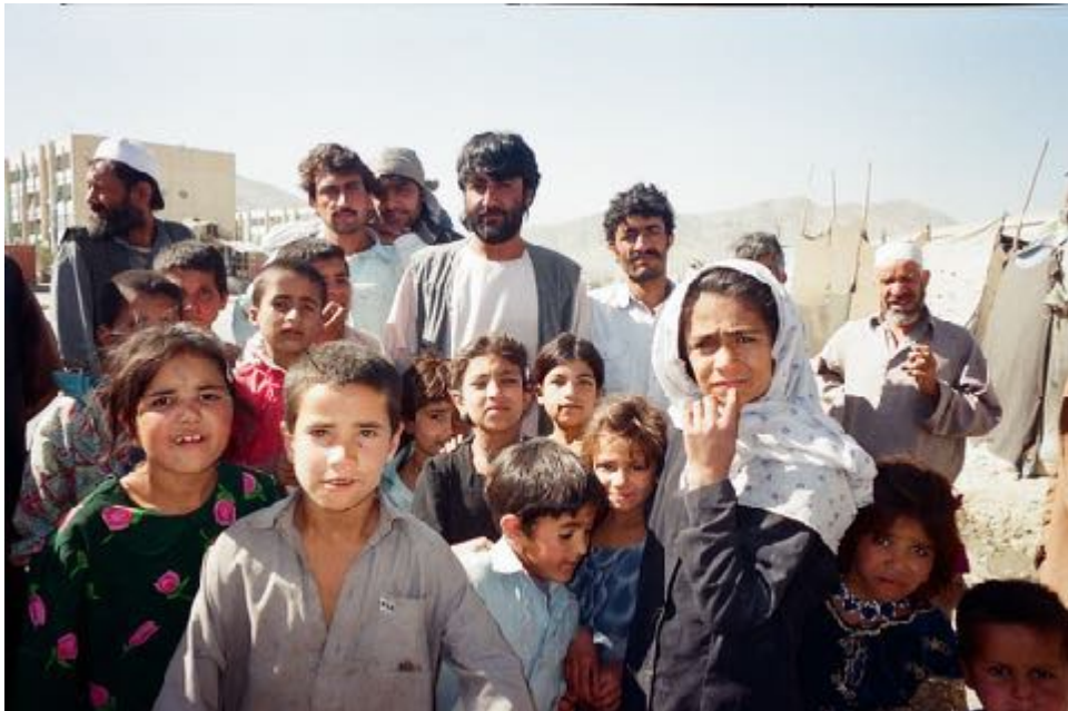
Foto: Campo de refugiados en la periferia de Kabul que lleva existiendo décadas. Esta foto la hice en 2004 y recordadla porque hablaré de una de las niñas que aparece que me la volvió a encontrar años después, en la frontera entre Serbia y Hungría, ella ya adulta, buscando una vida mejor.

La mayor parte de las personas refugiadas afganas están en Irán, Pakistán y Turquía.